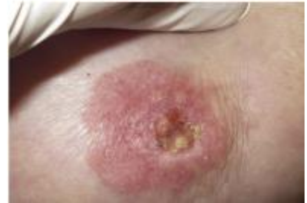
Abbildung 2: Morbus Paget